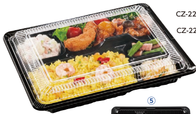
CZ-223-1 (N) BS黒 + CZ-223 透明蓋 (N)