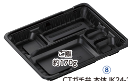
CTガチ弁 本体 IK24-20A BK