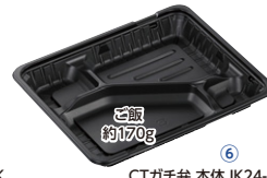
CTガチ弁 本体 IK24-20C2 BK