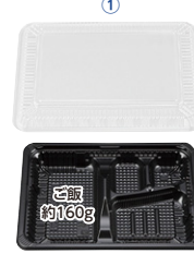
CZ-221 (N) BS黒 230×171×31mm