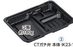
CTガチ弁 本体 IK23-17E2 BK