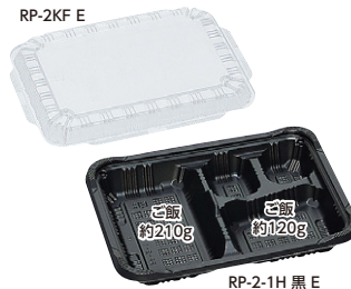
RP-2-1H 黒 E