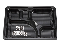
CZ-223 (N) BS黒