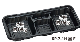
RP-7-1H 黒 E