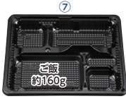
CZ-222-1 (N) BS黒