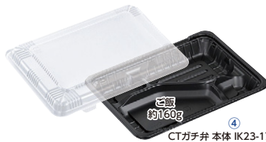
CTガチ弁 本体 IK23-17C2 BK