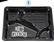
CZ-222 (N) BS黒