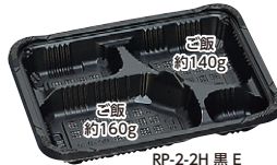
RP-2-2H 黒 E