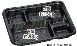
RP-4-2H 黒 E