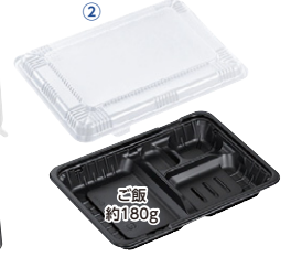
CTガチ弁 本体 IK23-17E2 BK 230×170×30mm