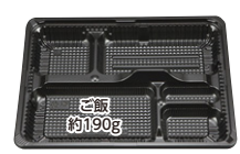
CZ-224 (N) BS黒