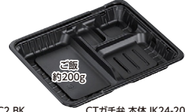
CTガチ弁 本体 IK24-20E2 BK