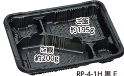
RP-4-1H 黒 E