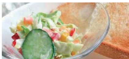
春野菜コールスロー

シェフズミラクル®ドリップ防止用は、お惣菜に混ぜるだけでドリップを防止し美味しさやコストの悩み解消をサポートします。サラダなどの加熱工程のないレシピにもお使いいただける、安心・安全な食品素材と食品添加物でできた、惣菜製造の現場で長年愛用されている商品です。