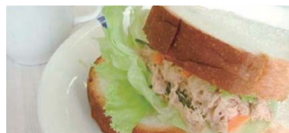
フレッシュツナサンド