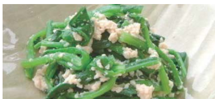
ほうれん草の白和え