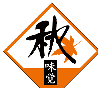
S-0262 1冊(500枚入) 注文番号 Y010949