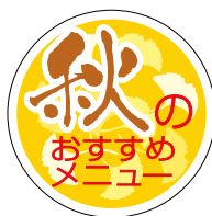
S-0270 1冊(1,000枚入) 注文番号 Y010961