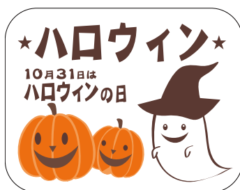
C-0400 1冊(500枚入) 注文番号 Y009382