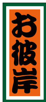
C-0235 1冊(1,000枚入) 注文番号 Y009377