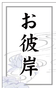
C-0396 1冊(300枚入) 注文番号 Y009376