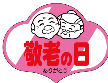
C-0312 1冊(500枚入) 注文番号 Y009378