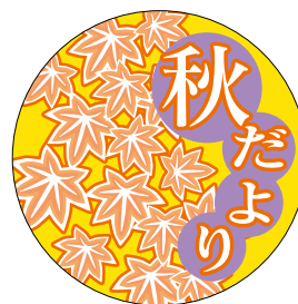
C-0317 1冊(500枚入) 注文番号 Y010965

プラスビズカタログには、季節・催事用の他にも 多数のラベルを取り扱っております。ぜひカタログもご覧ください。