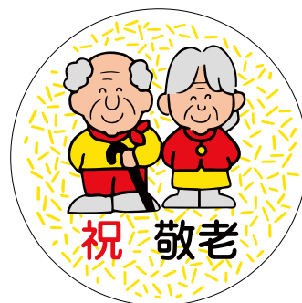
C-0233 1冊(500枚入) 注文番号 Y009379