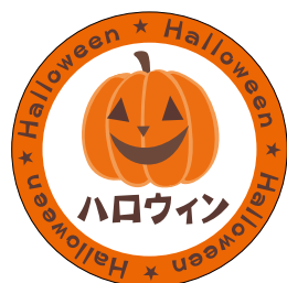
C-0399 1冊(500枚入) 注文番号 Y009383