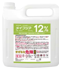
容量：4kg ポリノズル付