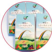
パッケージ デザイン