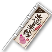
のぼり・Tシャツなど 展示会備品