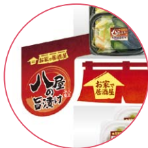
ポップなど販促物