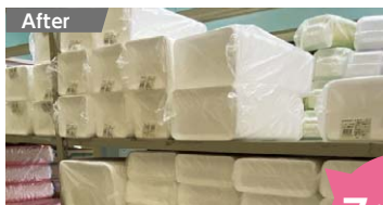
▲ ケース単位で大量に購入すると置き場に困りますが、小ロットなら必要な分だけ購入でき、置き場も綺麗に整頓できて安心です。