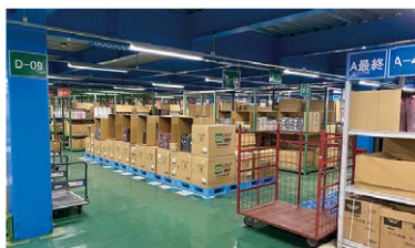
▲ 弊社の商品倉庫「亀山SSC」

弊社の商品倉庫である亀山SSCには、約700点のテイクアウト関連製品がずらり。1袋からの供給が可能な、小ロット対応の製品がたくさんあります。店舗での利便性を追求し、在庫ロスも軽減できます。また、弊社のオリジナルカタログにより検索も簡単です。