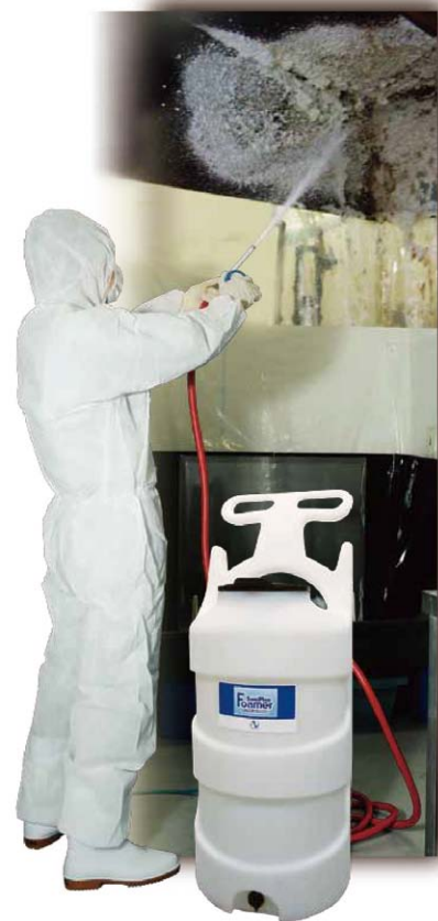
※泡洗浄機は別売りです。 ※コスト削減のシミュレーションは、実店舗の一例です。

アルカリと塩素の相乗作用で、油脂とタンパク質の汚れを強力に分解します。洗浄と同時に除菌が可能です。