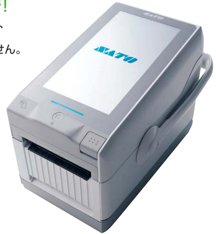
ラベルプリンター