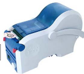
卓上ラベル剥離機