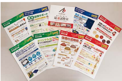
提案サポートチラシ