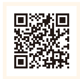
＼当社衛生機関のHPはこちら／