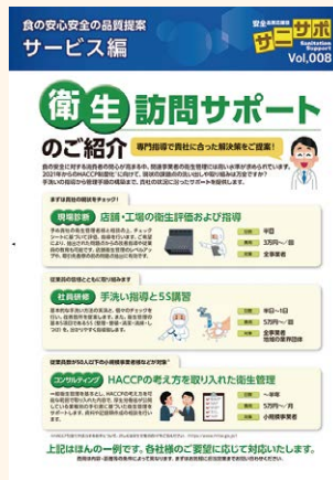
衛生に関する情報