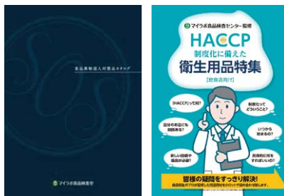
当社衛生機関のカタログ