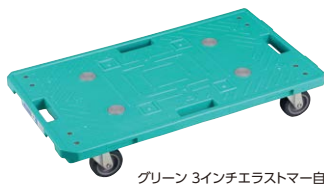
グリーン 3インチエラストマー自在×4