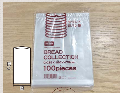
BR009 ラウンド食パン袋 L