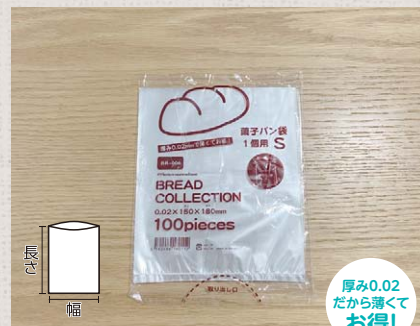
BR006 菓子パン袋1個用 S