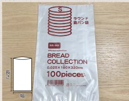
BR008 ラウンド食パン袋 S