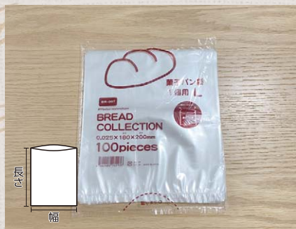
BR007 菓子パン袋1個用 L