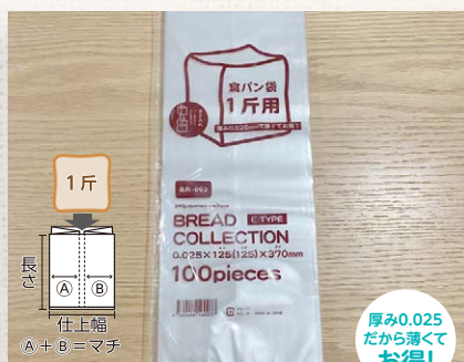
BR002 食パン袋1斤用Eタイプ